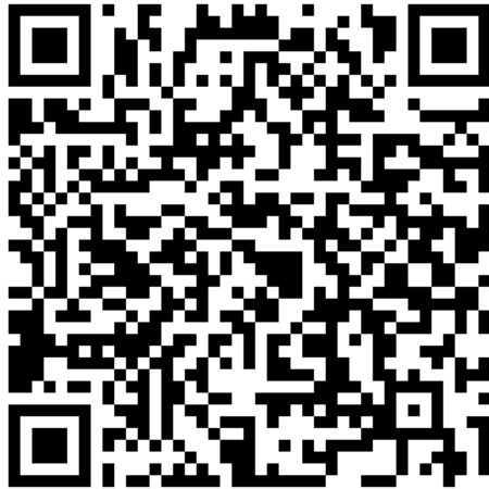
2024年度前期／春学期出願フォーム